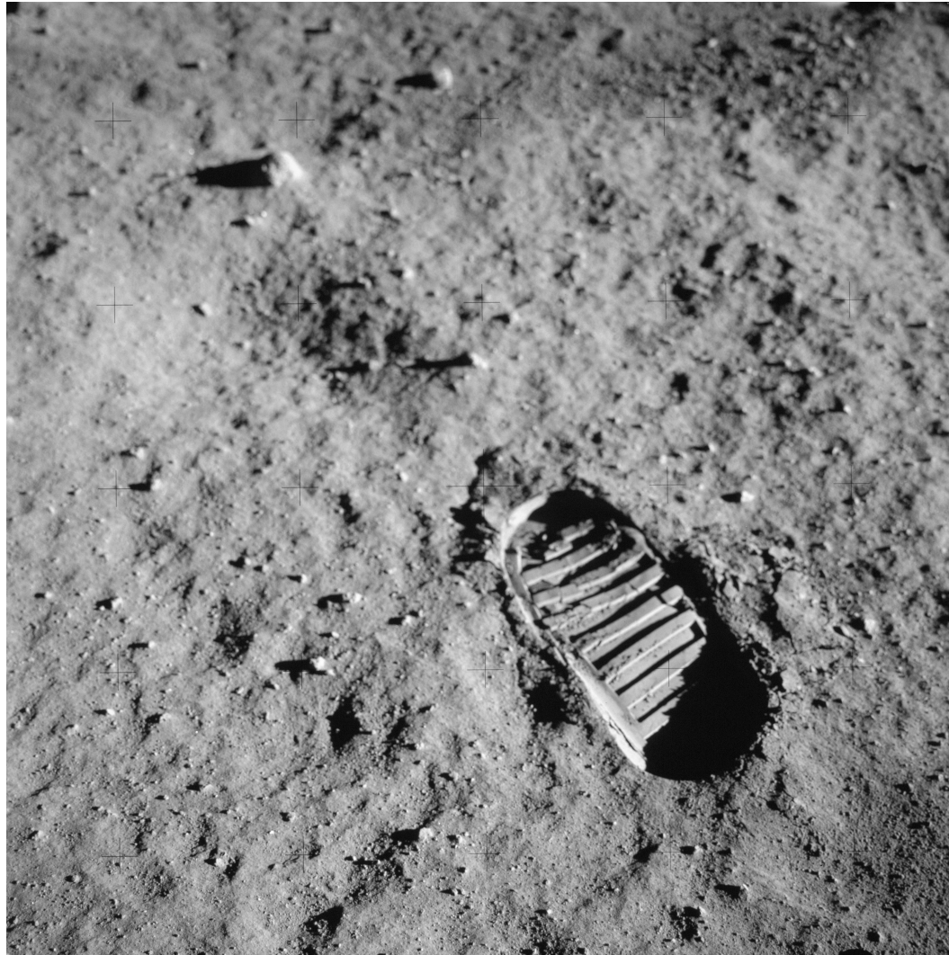
Figure A.1: Sideways figure/table example.