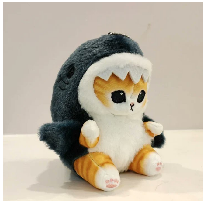
Figure 3: Scary Shark Catto

Lorem ipsum dolor sit amet, consectetur adipiscing elit. Ut purus elit, vestibulum ut, placerat ac, adipiscing vitae, felis. Curabitur dictum gravida mauris. Nam arcu libero, nonummy eget, consectetur id, vulputate a, magna. Donec vehicula augue eu neque. Pellentesque habitant morbi tristique senectus et netus et malesuada fames ac turpis egestas. Mauris ut leo. Cras viverra metus rhoncus sem. Nulla et lectus vestibulum urna fringilla ultrices. Phasellus eu tellus sit amet tortor gravida placerat. Integer sapien est, iaculis in, pretium quis, viverra ac, nunc. Praesent eget sem vel leo ultrices bibendum. Aenean faucibus. Morbi dolor nulla, malesuada eu, pulvinar at, mollis ac, nulla. Curabitur auctor semper nulla. Donec varius orci eget risus. Duis nibh mi, congue eu, accumsan eleifend, sagittis quis, diam. Duis eget orci sit amet orci dignissim rutrum.