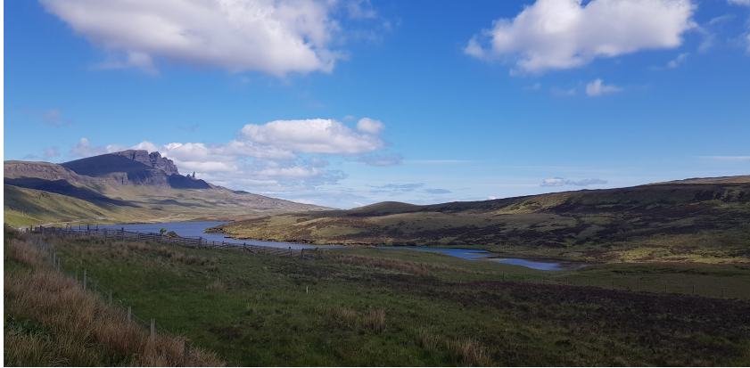
Fig. 1.1 Bonjour, je suis la légende de cette image. C'est donc une photo de l'île de Skye, a l'ouest de l'Écosse.

ea commodo consequat. Lorem ipsum dolor sit amet. Quis nostrud exercitation ullamco laboris nisi ut aliquip ex ea commodo consequat. Lorem ipsum dolor sit amet, consectetur adipiscing elit, sed do eiusmod tempor incididunt ut labore et dolore magna aliqua. Ut enim ad minim veniam, quis nostrud exercitation ullamco laboris nisi ut aliquip ex ea commodo consequat. Lorem ipsum dolor sit amet. Quis nostrud exercitation ullamco laboris nisi ut aliquip ex ea commodo consequat. Lorem ipsum dolor sit amet, consectetur adipiscing elit, sed do eiusmod tempor incididunt ut labore et dolore magna aliqua. Ut enim ad minim veniam, quis nostrud exercitation ullamco laboris nisi ut aliquip ex ea commodo consequat. Lorem ipsum dolor sit