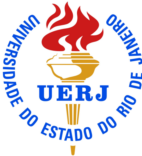
Figura 1 - Título da figura.