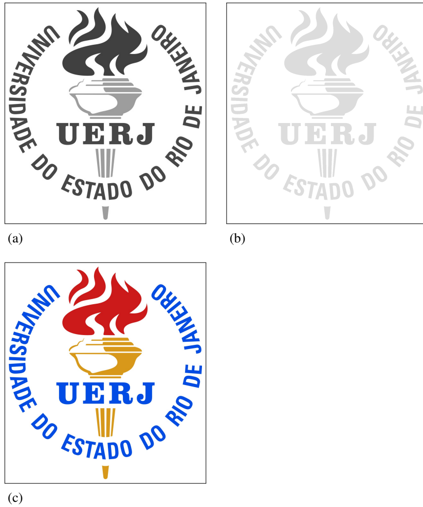
Figura 2 - Título da figura.

Legenda: Texto da legenda. (a) Texto da imagem; (b) Texto da imagem; (c) Texto da imagem.