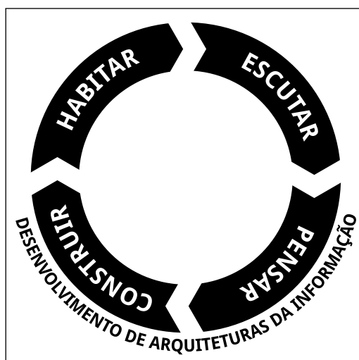
Figura 1 – Método de Arquitetura da Informação Aplicada – MAIA

E que tal uma figura? A Figura 1 – MAIA faz isso!