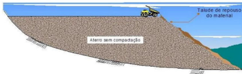
Figura 3 – Exemplo de Figura

Exemplo de como inserir uma figura. A Figura 3 aparece automaticamente na lista de figuras. Os arquivos das figuras devem ser armazenados no diretório de "/Figuras" . Para saber mais sobre o uso de imagens no \text{\LaTeX} consulte literatura especializada (GOOSSENS et al., 2007).