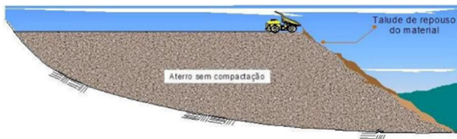
Figura 2 – Método de construção de pilha de estéril descendente